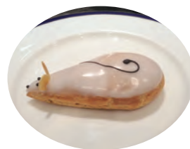
▲ネズミのシュークリーム