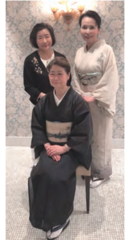
▲ルコト・サロン 7月12日