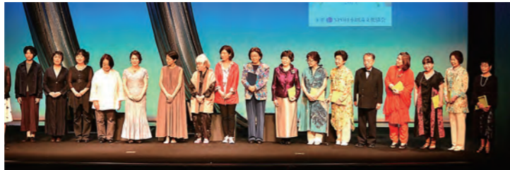
Bステージ カーテンコール