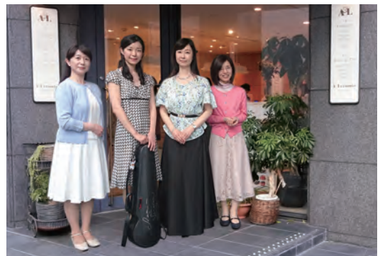
▼ルコト・サロン 6月4日