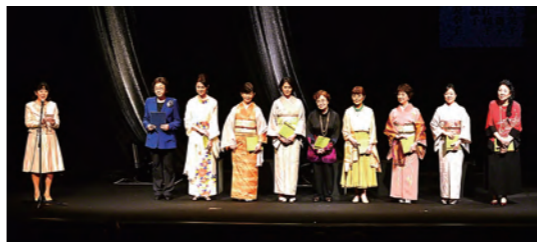
Cステージ「長恨歌」カーテンコール