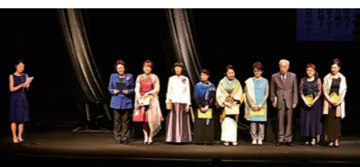
Dステージ「長恨歌」カーテンコール