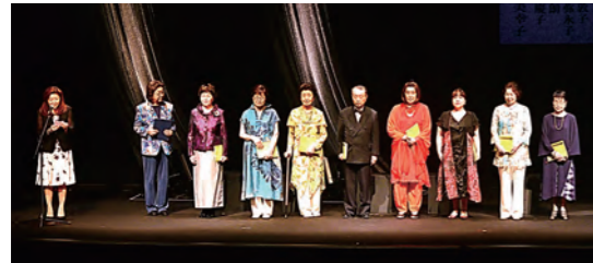
Bステージ「長恨歌」カーテンコール