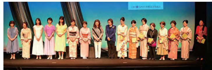
Cステージ カーテンコール