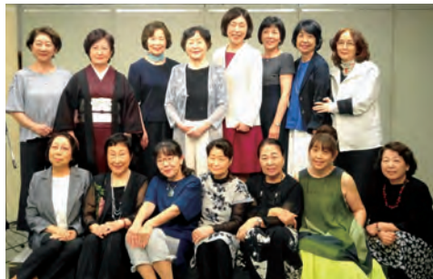
▶第115回出演者とスタッフ