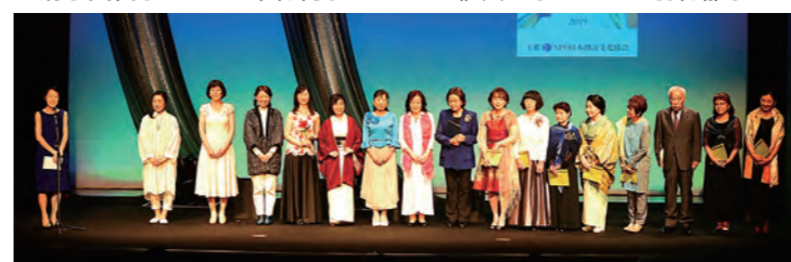
Dステージ カーテンコール