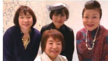
▲ルコト・サロン 5月17日