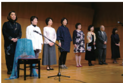
Aステージのフィナーレ