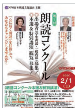
第8回「朗読コンクール」表彰式

台風のため、やむを得ず延期しました「朗読コンクール」は、2月1日（土）に開催されました。結果はあたらしくなったホームページでご覧ください。