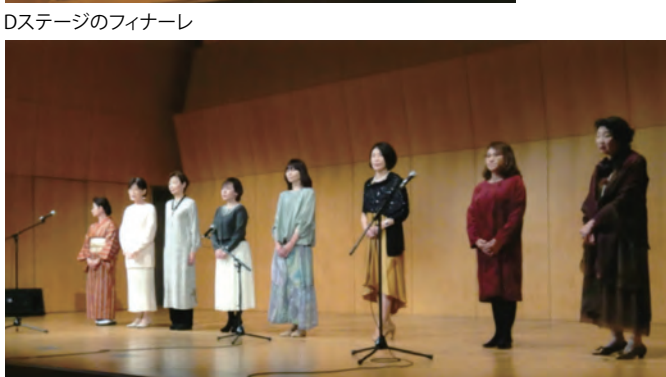
Dステージのフィナーレ