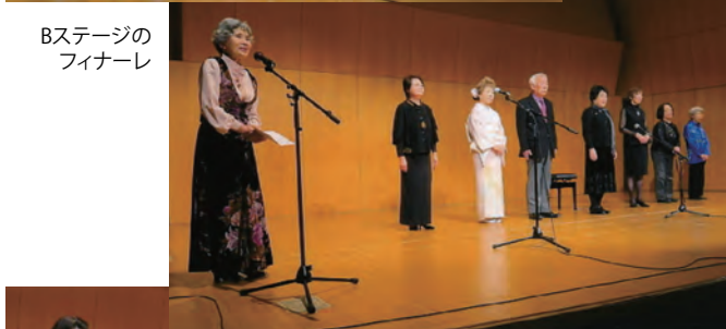
Bステージのフィナーレ