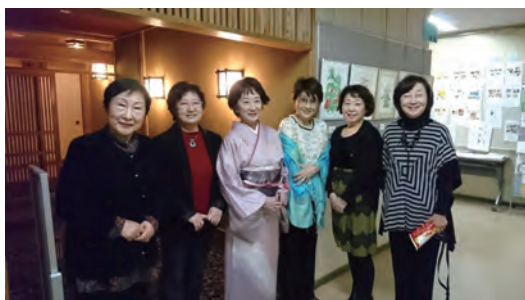
2019年11月22日、北新宿図書館にて。