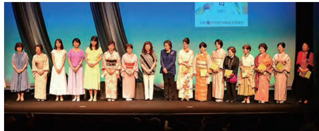
第17回「朗読の日」カーテンコール

「朗読の日」は2003年に、銀座博品館劇場にて開催されて以来、今年は18回目を迎えます。出演者も決まりました。今後研鑽を重ねて6月20日（土）・21日（日）の本番に臨みます。