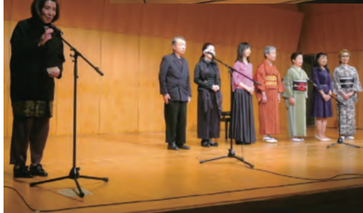
Cステージのフィナーレ