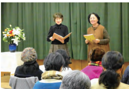
2019年12月7日、本駒込図書館にて。