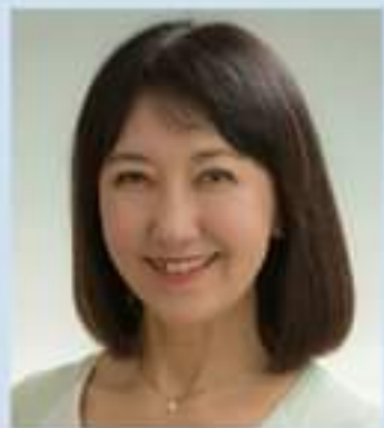
山田栄子 女優、声優

81プロデュース所属。女優、声優、プロデューサー。学生時代、文化庁推進の「ブルガリア、ハンガリー演劇祭」に参加。帰国後、劇団芸術ミュージカル「赤きんちゃん」の主役に抜擢され入団。数々の舞台を経て、アニメ「赤毛のアン」のアン役で、声優デビュー。その後声優として、鉄人28号 正太郎、若草物語 ジョオ、キャプテン翼 岬太郎、その他多数の声の主役を担当。現在、NHK人形劇「ざわむねのんこちゃん」に母役で出演中。又、新劇俳優協会主宰の朗読フェスティバルでは、奨励賞2回、観客賞1回受賞。