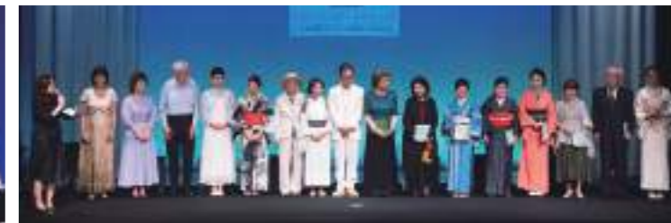
Bステージ カーテンコール