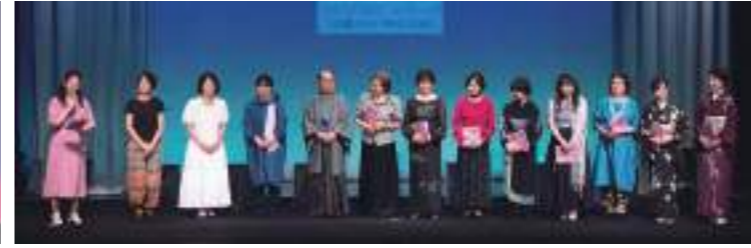
Dステージ カーテンコール