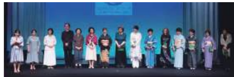
Aステージ カーテンコール