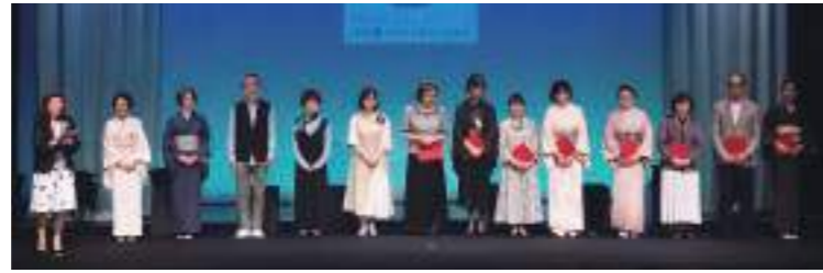
Cステージ カーテンコール